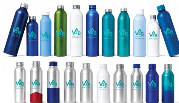
CHAI NHÔM THỰC PHẨM

Chai nhôm cho mỹ phẩm, chăm sóc cá nhân và giải pháp nâng tầm hình ảnh thương hiệu.