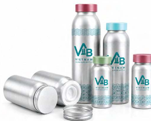
CHAI NHÔM DƯỢC PHẨM