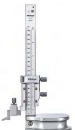
THƯỚC ĐO ĐỘ CAO