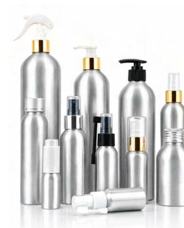
CHAI NHÔM HÓA MỸ PHẨM