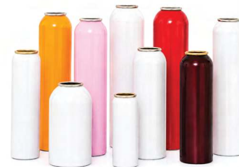
CHAI NHÔM AEROSOI