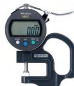
THƯỚC ĐO ĐỘ DÀY