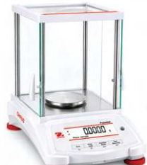
THIẾT BỊ ĐO LƯỜNG