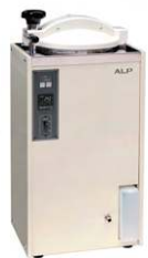
MÁY HẤP TIỆT TRÙNG