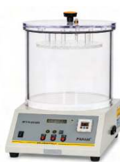
MÁY KIỂM TRA RỖ RỈ