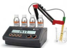
MÁY ĐO ĐỘ DẪN ĐIỆN