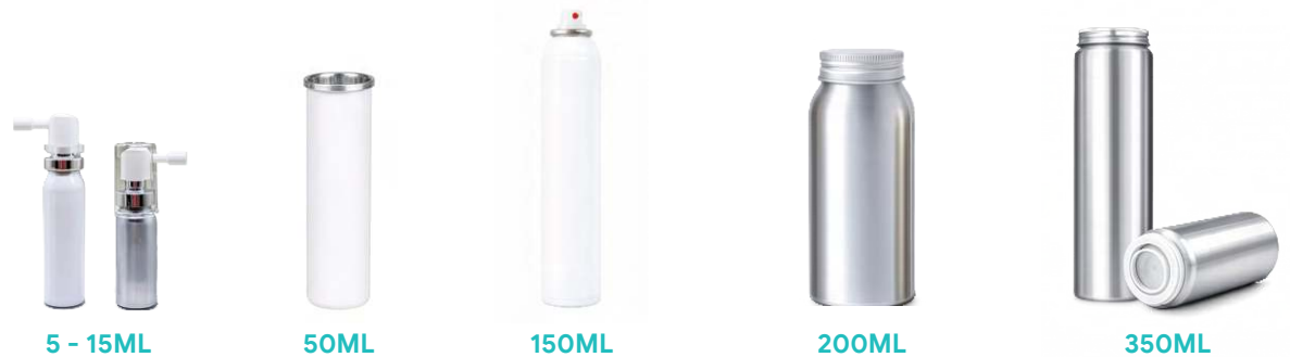
5 - 15ML