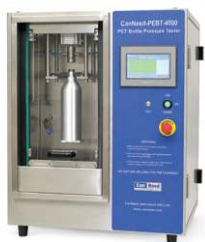
MÁY ĐO ÁP SUẤT